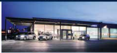
Autohaus Mack Illertissen

Öffnungszeiten: Mo-Fr: 9.00 - 18.30 Uhr Sa: 8.00 - 14.00 Uhr