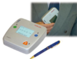
Der kleinste AED der Welt!

Der AED-Defibrillator „FRED easyport“ ist speziell für die Laien-Defibrillation konzipiert. Durch die deutlich hörbaren Sprachanweisungen können Sie nichts falsch machen!