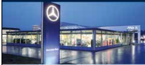
Autohaus Mack Senden

Flughafen-Land Str. 3 Tel. 0 73 07 794 94-0 www.autohaus-mack.de